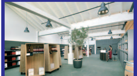
Delinat: Wein präsentieren und verkaufen.