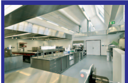
Gastro Solothurn: helle, moderne Küche.