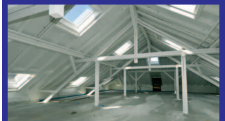
Zu vermieten: Platz für neue Büroräume.